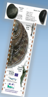
La réglette de mesure des coquillages