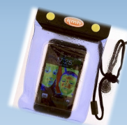
Une pochette étanche pour le téléphone