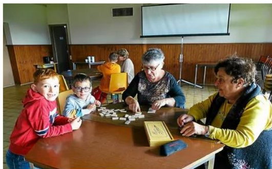
Les enfants du centre de loisirs ont joué à des jeux de société avec les seniors vendredi 4 novembre.