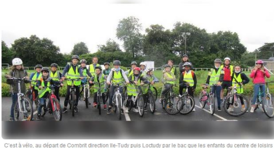
C'est à vélo, au départ de Combrit direction Ile-Tudy puis Loctudy par le bac que les enfants du centre de loisirs