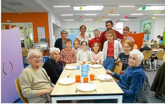
Seniors et enfants ont déjeuné ensemble, mercredi midi, au restaurant scolaire.