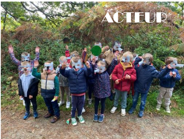
Les enfants du bourg se prêtent au jeu d'acteur dans les bois de Combrit.