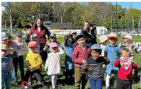
Les plus jeunes se sont amusés dans le parc de Karlisten Jeudi.