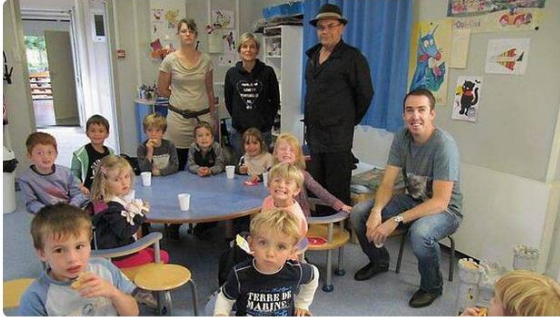
Les 3-6 ans sont accueillis à l'école maternelle du bourg, à Combrit. |