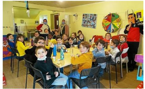
C'est l'heure du goûter, chaque enfant possède sa gourde d'eau : une exigence du protocole sanitaire, comme à l'école, qui est devenue une habitude.