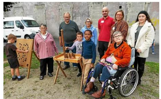
Les enfants et les seniors ont joué toute l'après-midi, accompagnés des animateurs du centre de loisirs et de la résidence Karbon'his.