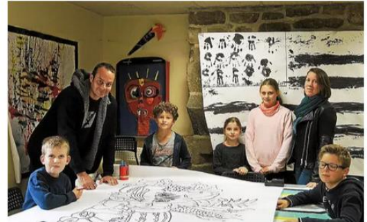
Le centre de loisirs accueille des enfants de Combrit, Ile-Tudy et Tréméoc tous les mercredis. Il sera ouvert, pendant les vacances d'automne, du 23 octobre au 3 novembre.