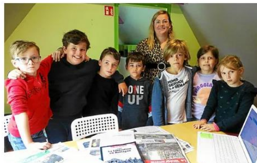
Les enfants du centre de loisirs préparent une véritable gazette pour les 10 ans du centre.