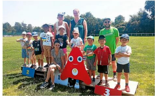
Les enfants du centre de loisirs ont participé aux olympiades Terre de Jeux mercredi.